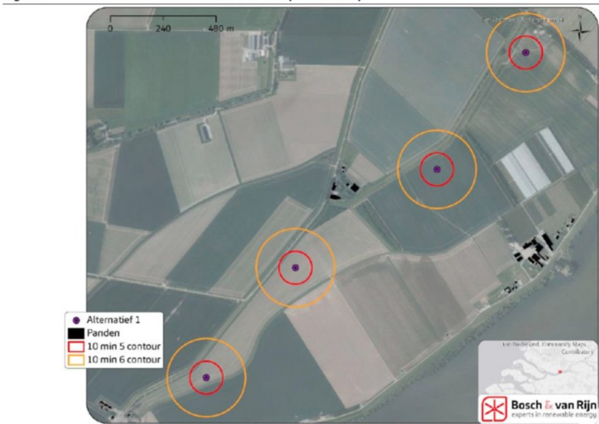
Figuur 5 Risicocontouren rond de windturbines (Alternatief 1)

Alle rapportages over windenergie geven duidelijke kaarten met locaties van windmolens en zoneringen. Zie hiervoor enkele voorbeelden: ook van Bosch & Van Rijn zelf!